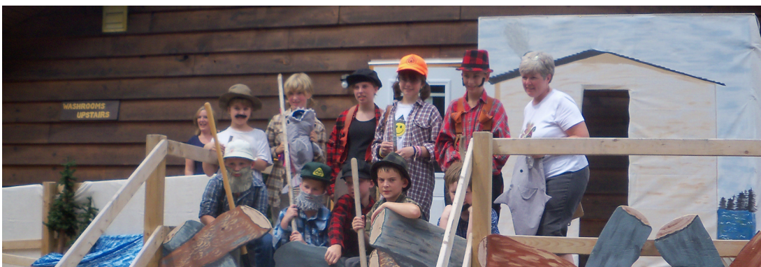
« Sapling Theater Troupe » au Musée Central des bûcherons du NB