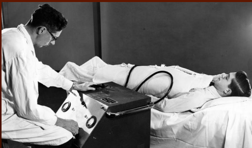
En haut à gauche: Stimulateur cardiaque